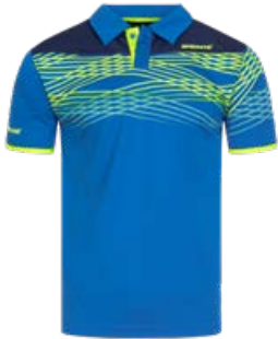
CLASH / CLASHFLEX ROYAL BLUE-NAVY