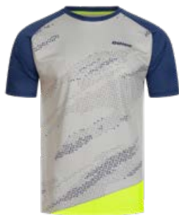
MIRAGE GREY-NAVY-FLUO YELLOW