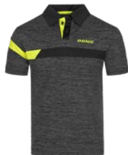
STRIPES ANTHRACITE MELANGE