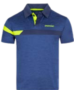
STRIPES BLUE MELANGE