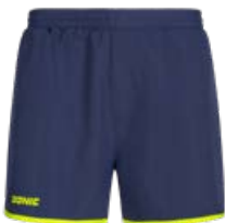
LOOP NAVY-FLUO YELLOW