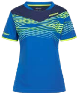
CLASH LADY ROYAL BLUE-NAVY