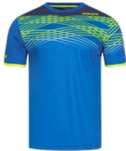
CLIX ROYAL BLUE-NAVY