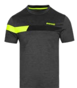
STUNNER ANTHRACITE MELANGE