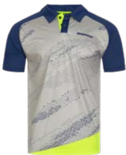
MEGA GREY-NAVY-FLUO YELLOW