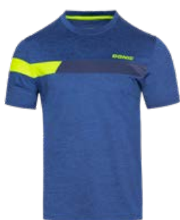
STUNNER BLUE MELANGE