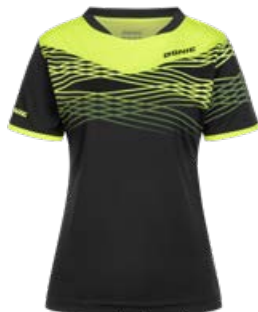
CLASH LADY BLACK-FLUO YELLOW