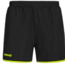
LOOP BLACK-FLUO YELLOW