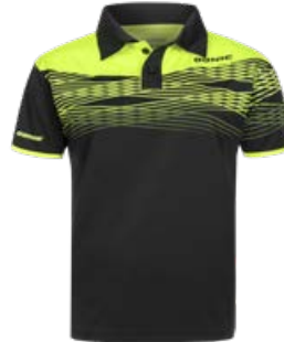
CLASH / CLASHFLEX BLACK-FLUO YELLOW