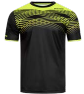
CLIX BLACK-FLUO YELLOW