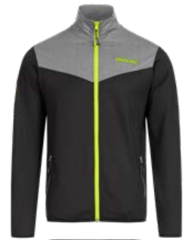
PRISMA BLACK-GREY MELANGE