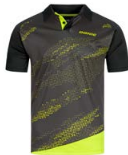
MEGA BLACK-FLUO YELLOW