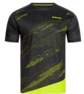
MIRAGE BLACK-FLUO YELLOW